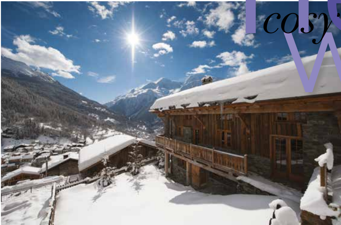
IRWIN / ELEVEN EXPERIENCE